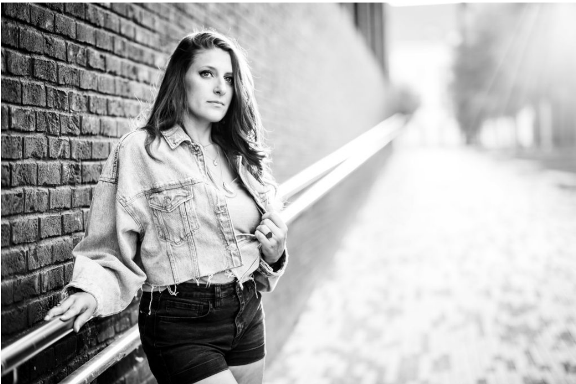
Même ce portrait très récent pourrait avoir été capturé dans les années 50-60...