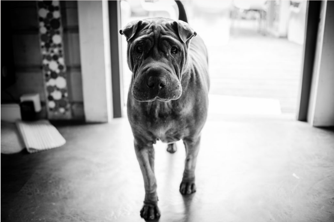
Ici encore, difficile de dire quand et où ce chien a été photographié.