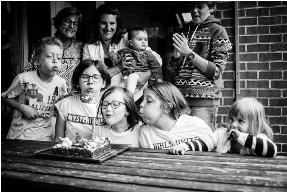
Dans cette scène, la première chose qui attire le regard du lecteur ce sont les 4 enfants qui soufflent les bougies ensemble.

Ne pas considérer la couleur, c'est réduire l'effet des éléments colorés présents dans la scène pour mettre l'accent sur le sujet et plus particulièrement sur les émotions ou les regards lorsque vous capturez des scènes de vie incluant des personnes. Ce qui a tendance à renforcer l'intérêt de ces regards et de ces émotions. C'est un peu comme si on réduisait la quantité d'information que l'on envoie au cerveau et qu'il pouvait donc les traiter plus rapidement. Comme s'il y avait moins de distraction et qu'il allait plus vite droit au but. Les regards et les émotions sont déjà des sujets à part entière qui fonctionnent très bien, même en couleur. Mais la plupart du temps, l'effet est décuplé grâce au noir et blanc.