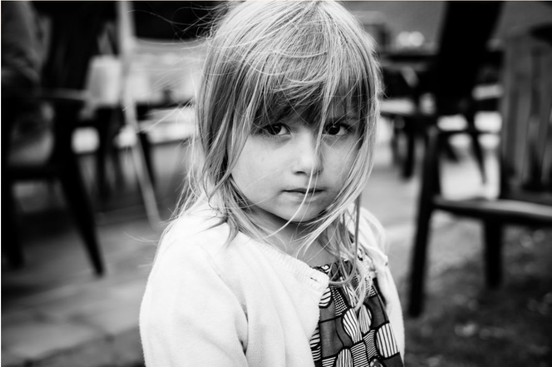
Le regard intense de cette petite fille ne peut laisser indifférent... en couleur l'effet n'est pas aussi intense.