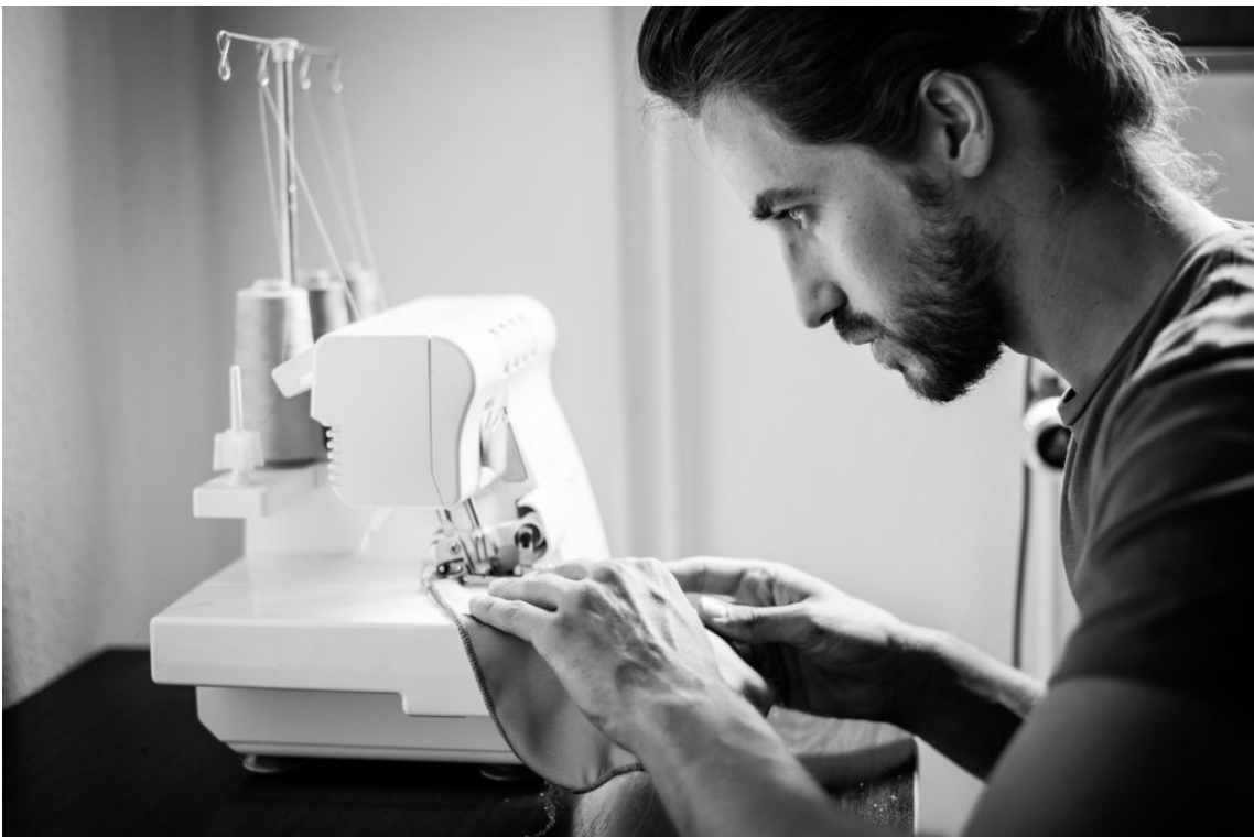
Sur cette photo, le traitement noir et blanc accentue le regard concentré du sujet de manière significative.