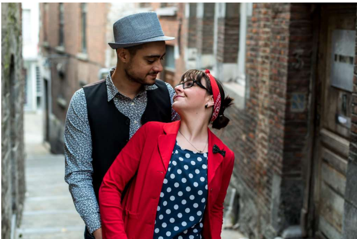
Si vous êtes très loin de votre sujet, vous obtiendrez une atmosphère beaucoup moins dramatique