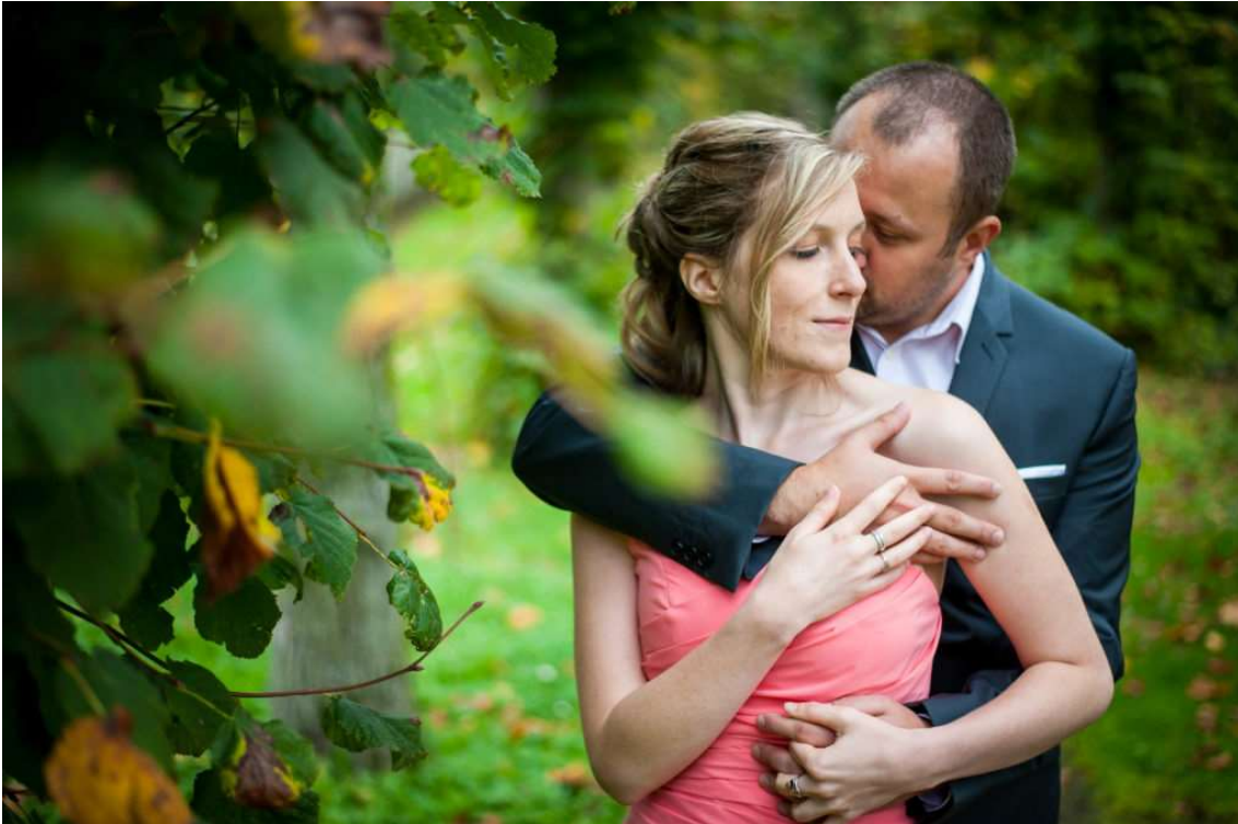
Portrait de couple pris au 50mm à f/1.8, 1/400s, 320 ISO

Une part de la maîtrise de vos objectifs est de connaître leurs performances aux différentes ouvertures. Il y a pour cela deux choses à considérer : Les performances techniques et la qualité esthétique.