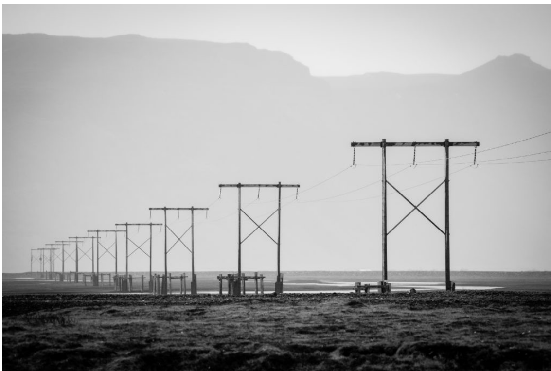
Paysage Islandais réalisé au téléobjectif à 220mm, f/5.6, 1/800, 500 ISO. On observe le rapprochement des plans.

Si vous avez un téléobjectif, comment pouvez-vous optimiser la compression de perspective que vous donnent vos objectifs ? Quels sujets pouvez-vous photographier pour donner l'effet de couche obtenu avec des objectifs plus longs. ? C'est un processus d'expérimentation. Tous vos essais ne seront pas concluants. Mais lorsque les résultats sont bons, comme pour l'astuce précédente, vous ajouterez de nouvelles capacités à votre répertoire. Voici une photo de paysage prise au téléobjectif.