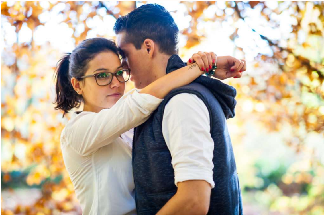
Portrait de couple à 70mm

Cette approche simplifie le travail pour apprendre à connaître votre zoom car vous limitez votre apprentissage à deux ou trois longueurs focales plutôt qu'à chacune d'elles sur l'entièreté de la plage des focales de votre objectif.