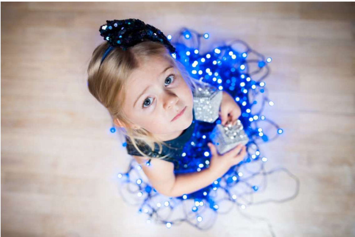
Portrait au 24mm à f/2, 1/100s, 500 ISO

Si vous utilisez un grand-angle pour du portrait , vous vous rendrez bientôt compte qu'en étant trop proche de votre modèle, cela créera des effets qui ne sont pas très flatteurs. Mais qu'en est-il si vous faites quelques pas en arrière et intégrez une plus grande partie de votre environnement ? Soudain, vous faites une approche très différente que celle que vous auriez pris avec un petit téléobjectif (70mm ou 85mm). De telles expériences, peuvent ajouter de nouvelles compétences et façons de photographier à votre répertoire. J'ai pris ce portrait avec mon 24mm, en contre-plongée qui plus est. J'ai obtenu un cliché original.