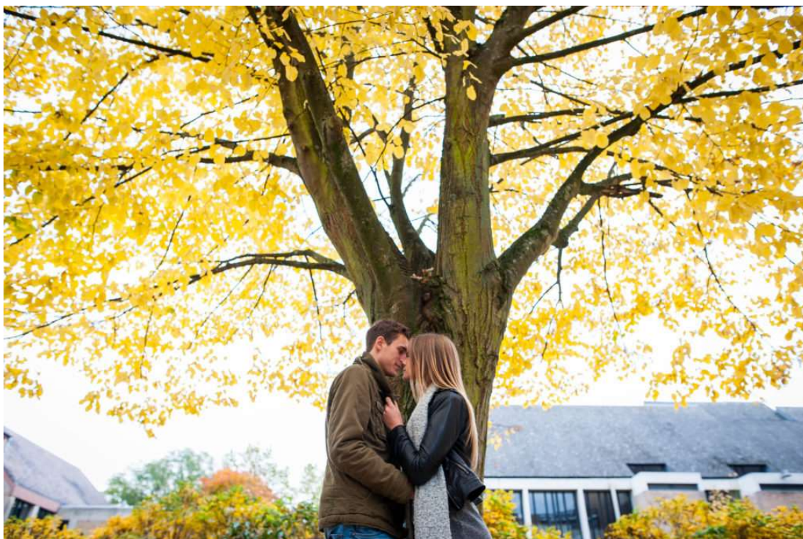
Portrait de couple réalisé au 24mm à f/2.8, 1/125s, 250 ISO

Dans son livre Outliers , Malcolm Gladwell met en avant une idée bien connue aujourd'hui. Il dit que la maîtrise d'une matière ou d'un sujet particulier s'obtient avec 10.000 heures de pratique. Cette idée de 10.000 heures de pratique pourrait s'appliquer à la photographie dans son ensemble plutôt qu'au fait d'utiliser un seul objectif en particulier. Mais il n'y a aucun doute sur le fait qu'utiliser le même objectif pendant une durée prolongée va vous aider à bien connaître cet objectif. Vous pouvez mettre cette idée en pratique de façon assez simple, juste en prenant un seul appareil et une seule optique pour votre prochaine séance, quelle qu'elle soit. Par exemple, si vous avez un shooting portrait, prenez votre téléobjectif et calez le à une focale (105mm ou 300mm selon ce que vous avez). Si vous choisissez de faire du paysage, prenez votre objectif grand-angle (18mm ou 24mm). La prochaine fois, faites l'inverse. L'idée est d'utiliser la même focale sur toute la séance.