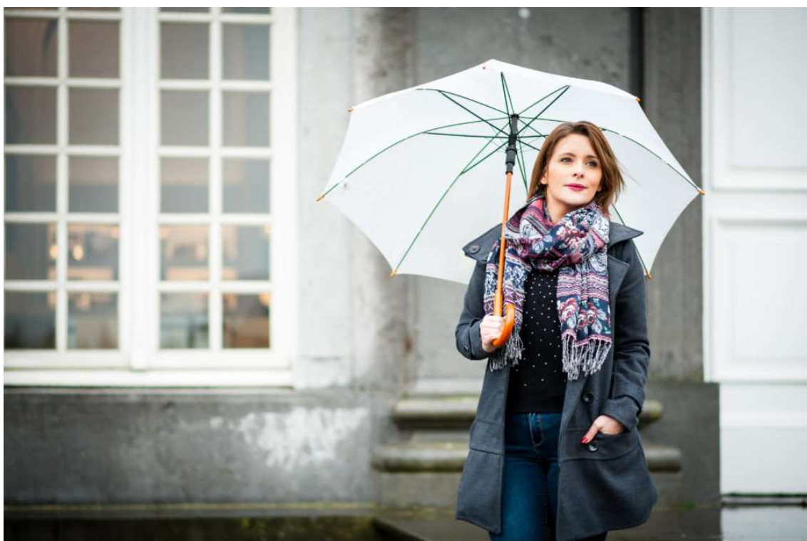
Portrait réalisé au 85mm, à f/2, 1/400s, 400 ISO

Je prends souvent une seule optique pour mes shootings portrait. C'est d'ailleurs le seul objectif dont je ne me sépare jamais pour une séance portrait, je parle du petit télé 85mm f/1.8. Vous pouvez aller plus loin en allongeant l'exercice sur une durée d'une semaine, un mois, et même plus. C'est à vous de le sentir... Cet exercice est des plus faciles avec une focale fixe. Cependant, si vous utilisez un zoom, je vous suggère de simplement choisir une longueur focale, 50mm au hasard □, et de ne plus y toucher (pendant la durée du shooting). L'idée est de vous familiariser avec le comportement d'une longueur focale particulière. Après quelque temps, une journée, une semaine ou un mois selon vos envies, passez à une autre longueur focale (24mm, 85mm ou 200mm).