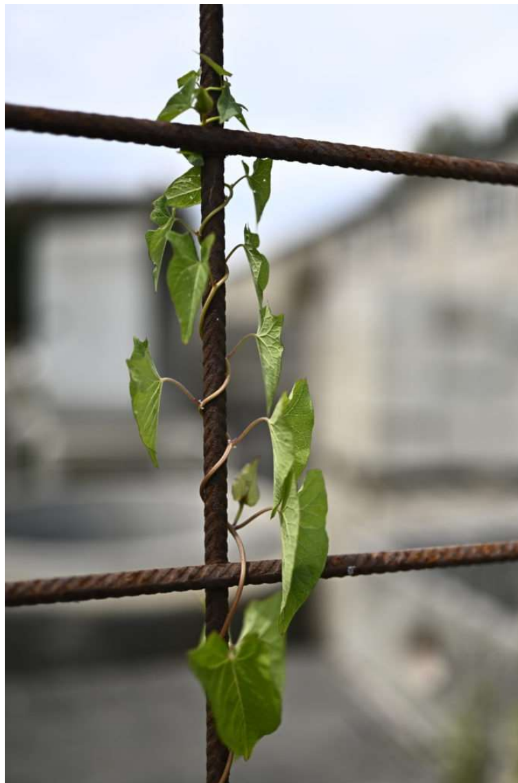
La nature prisonnière

Tout le monde aime les belles images ! Mais les gens aiment d'autant plus les images qui transmettent une émotion, un ressenti. Celles qui amènent à les faire réfléchir, se questionner ou stimuler leur imagination. Le plus souvent, si quelque chose se passe lorsque vous regardez une photo, c'est que le photographe a su faire passer son message à travers à elle. Et son intention photographique lui a permis de le faire.