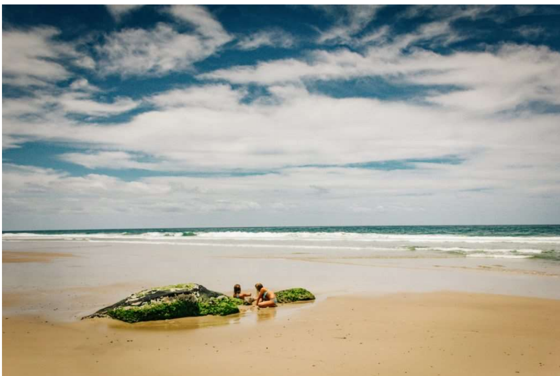
Enfants qui jouent sur une plage