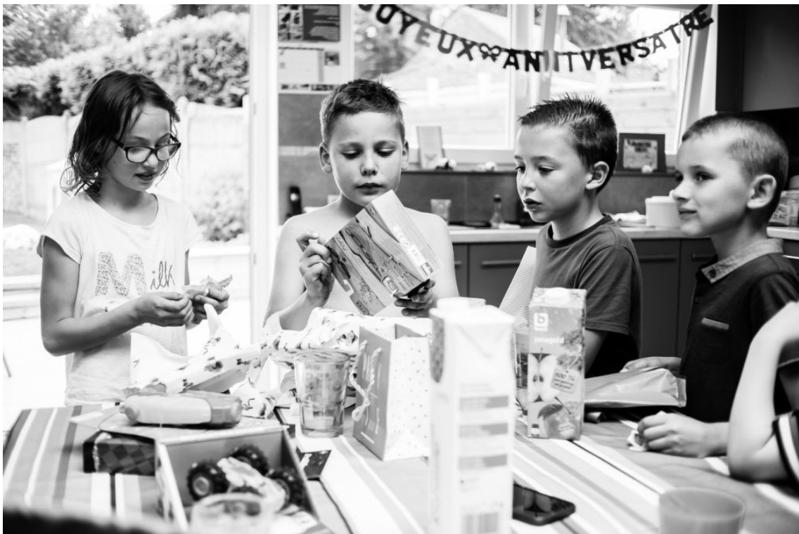
Joyeux anniversaire !