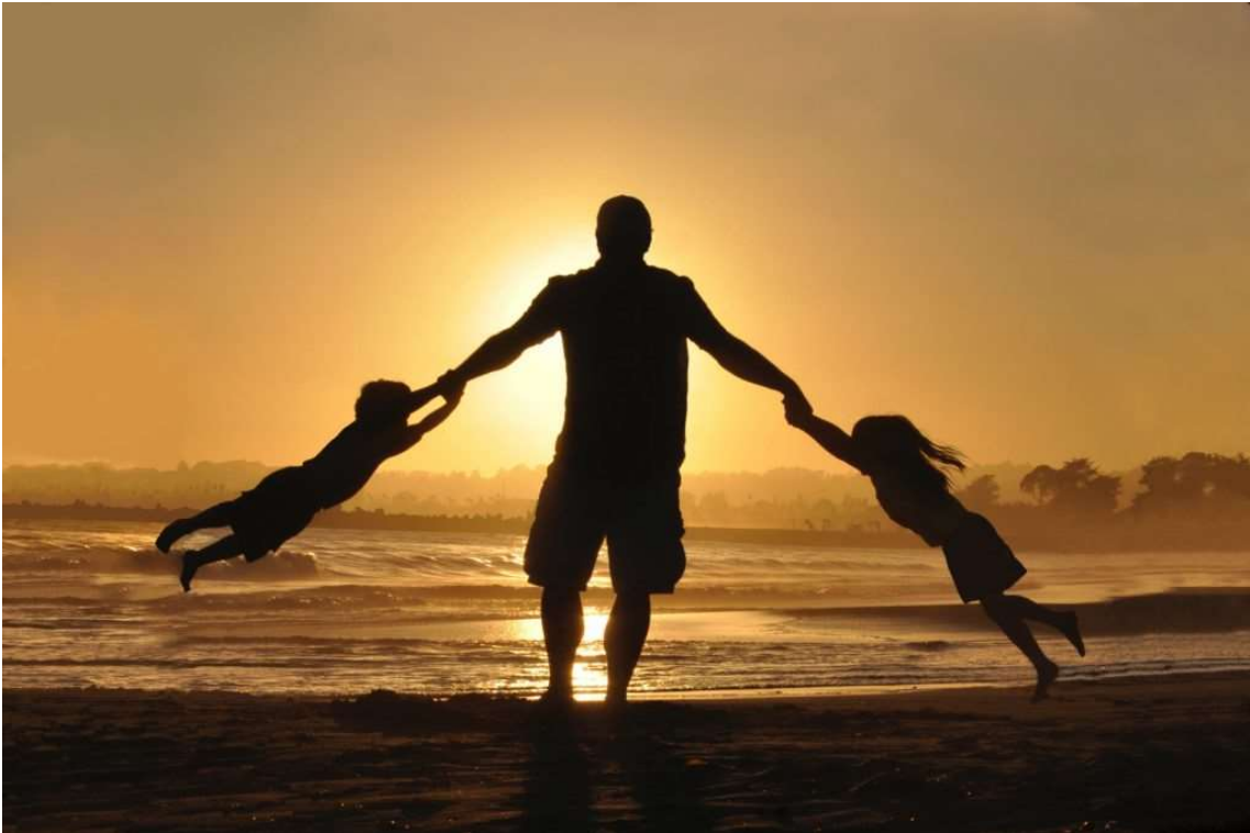
Papa jouant sur la plage avec ses enfants

... ou plutôt capturer et montrer la complicité et le plaisir qu'ils partagent avec leur papa.