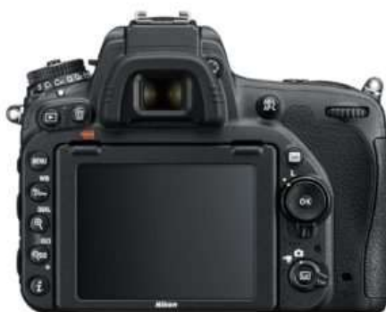
Viseur centré du Nikon D750 (Reflex)

Lorsque j'ai commencé la photo en 2008, mon œil gauche s'est naturellement présenté comme étant celui que j'utiliserais pour prendre mes photos. Je ne me suis jamais vraiment posé de question à ce niveau là. J'ai utilisé mes appareils reflex de cette façon de nombreuses années. Comme vous le savez le reflex possède un viseur central, aligné avec l'objectif .