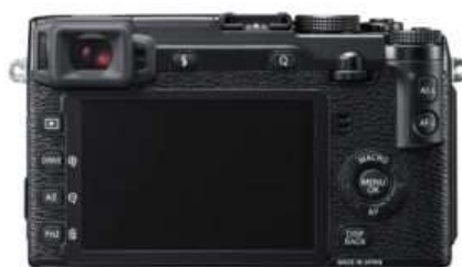
Viseur décentré à gauche du Fujifilm X-E2 (Hybride)

Un jour, j'ai eu un autre modèle d'appareil photo entre les mains et je me suis senti inconfortable. Sans trop comprendre, je me suis forcé à l'utiliser comme je le faisais avec mon reflex. Plus tard, pour voyager, j'ai opté pour un appareil hybride de chez Fujifilm , le X-E2, dont le viseur se trouve sur le côté gauche du boîtier . Mon nez se retrouvait systématiquement écrasé sur l'écran. Avec tous les désagréments que cela comporte. J'ai malgré tout continué à utiliser mon œil gauche au début.