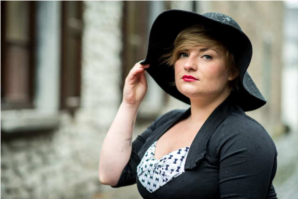
Un cadrage plus serré lui donne plus d'importance tout en accrochant l'œil du lecteur. Le décor tend à disparaître.