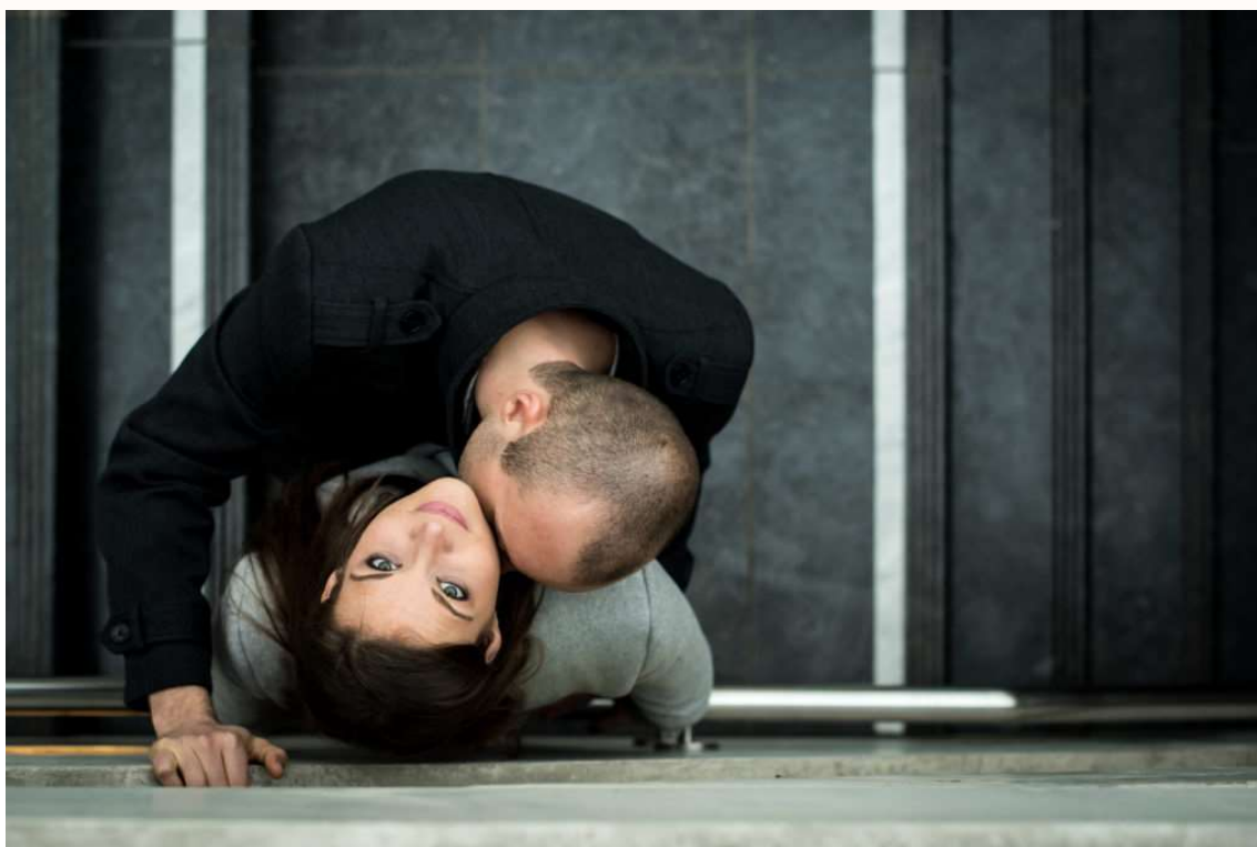
He loves me