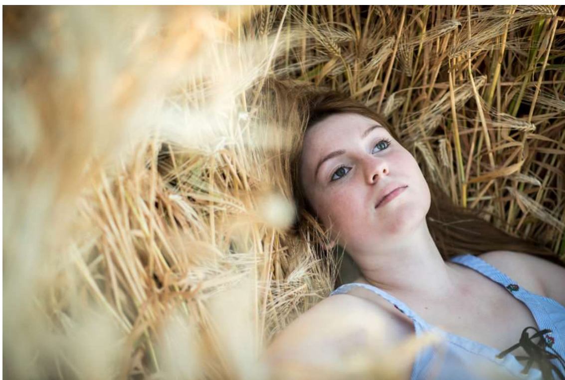
Portrait d'été