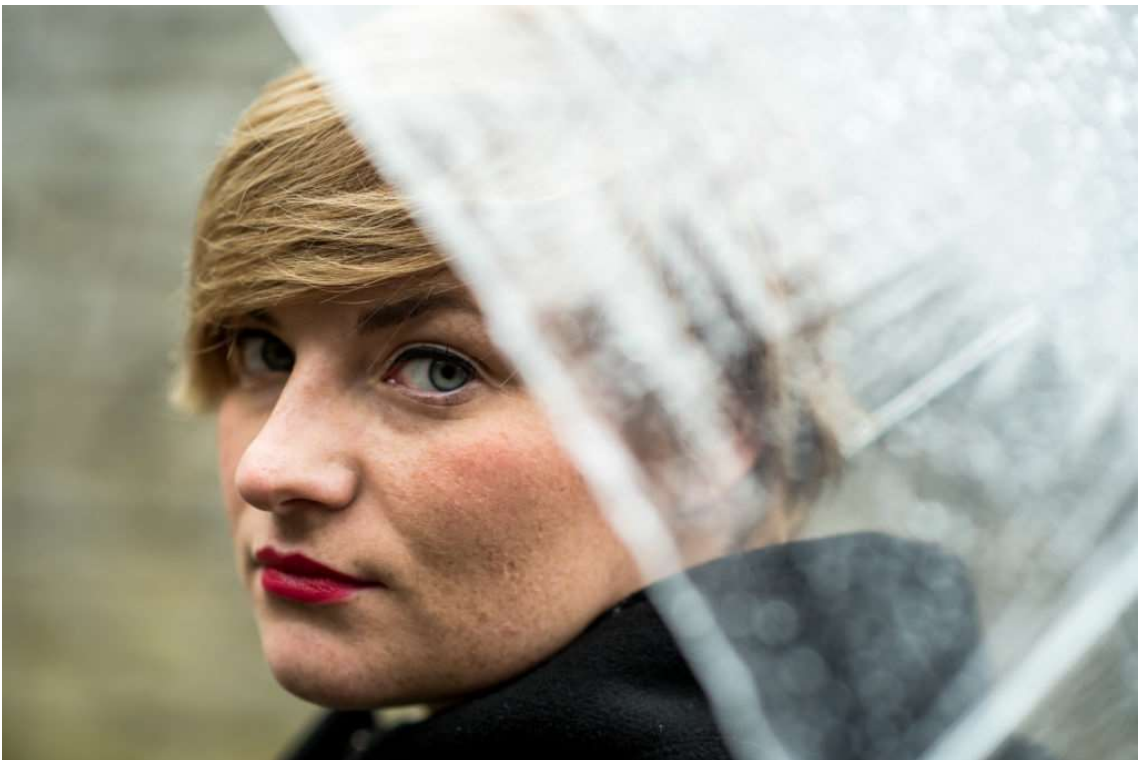
En remplissant le cadre, on ne voit plus que le visage du sujet et l'œil est attiré par des détails comme les yeux et les lèvres.