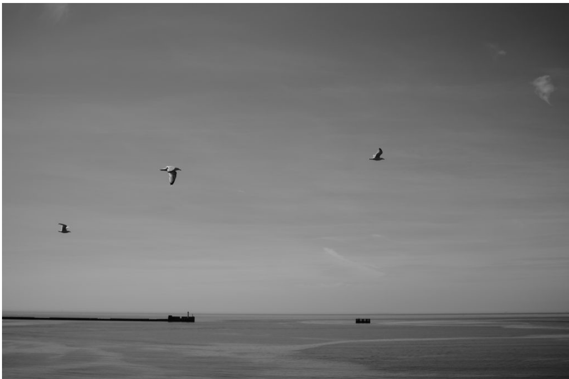
North Sea