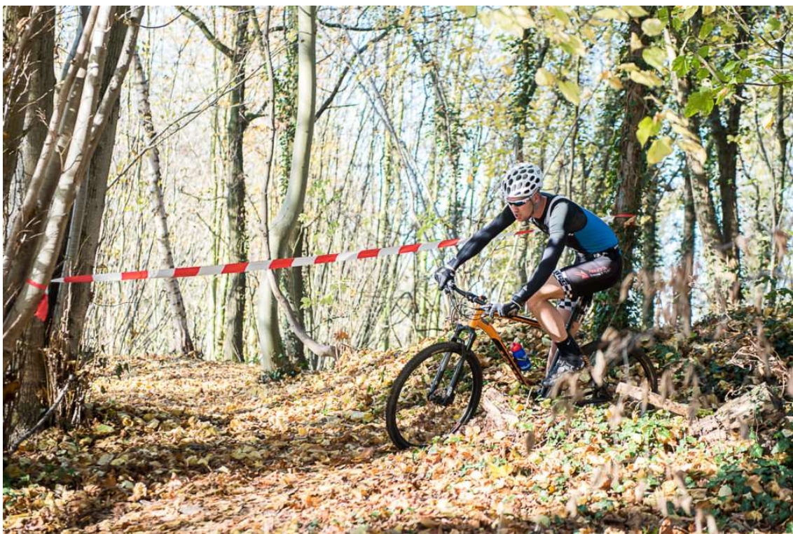
Ce principe est applicable à la plupart des photographies de sport