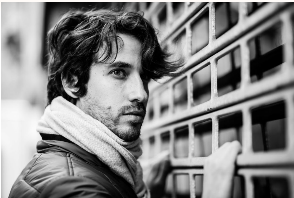
Dans le cadre de ce portrait, le modèle regarde vers la droite. Raison de l'espace laissé de ce côté. Ici l'espace est comblé par la répétition de rectangles du grillage