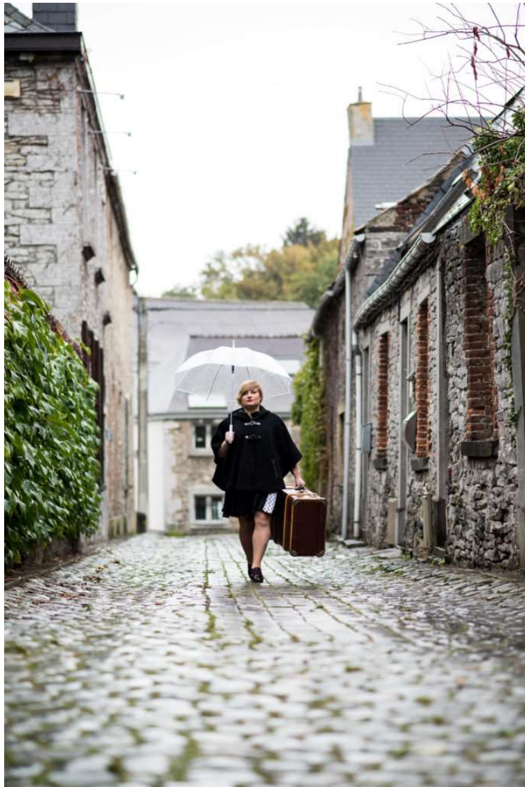
Ici lors d'une séance portrait, la modèle est plutôt loin et un peu perdue dans le décor

Bien que ce ne soit pas vraiment naturel pour tout le monde, remplir le cadre permet de donner plus d'impact à vos images. Surtout lorsque les images sont petites comme dans un magazine ou dans un article sur internet. En effet, des sujets tout petits, perdus au beau milieu d'une image n'auront pas vraiment autant d'effet que s'ils prenaient les 3/4 voir la totalité du cadre. Doit-on pour autant toujours cadrer serré ? Évidemment NON ! Il est important de pouvoir doser et laisser le sujet "respirer". Un peu d'espace autour du sujet lui donnera un peu de liberté. Il sera moins collé au bord.